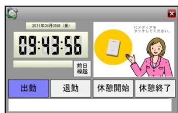
「ICタイムリコーダー」 打刻画面